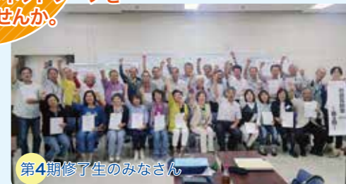
第4期修了生のみなさん