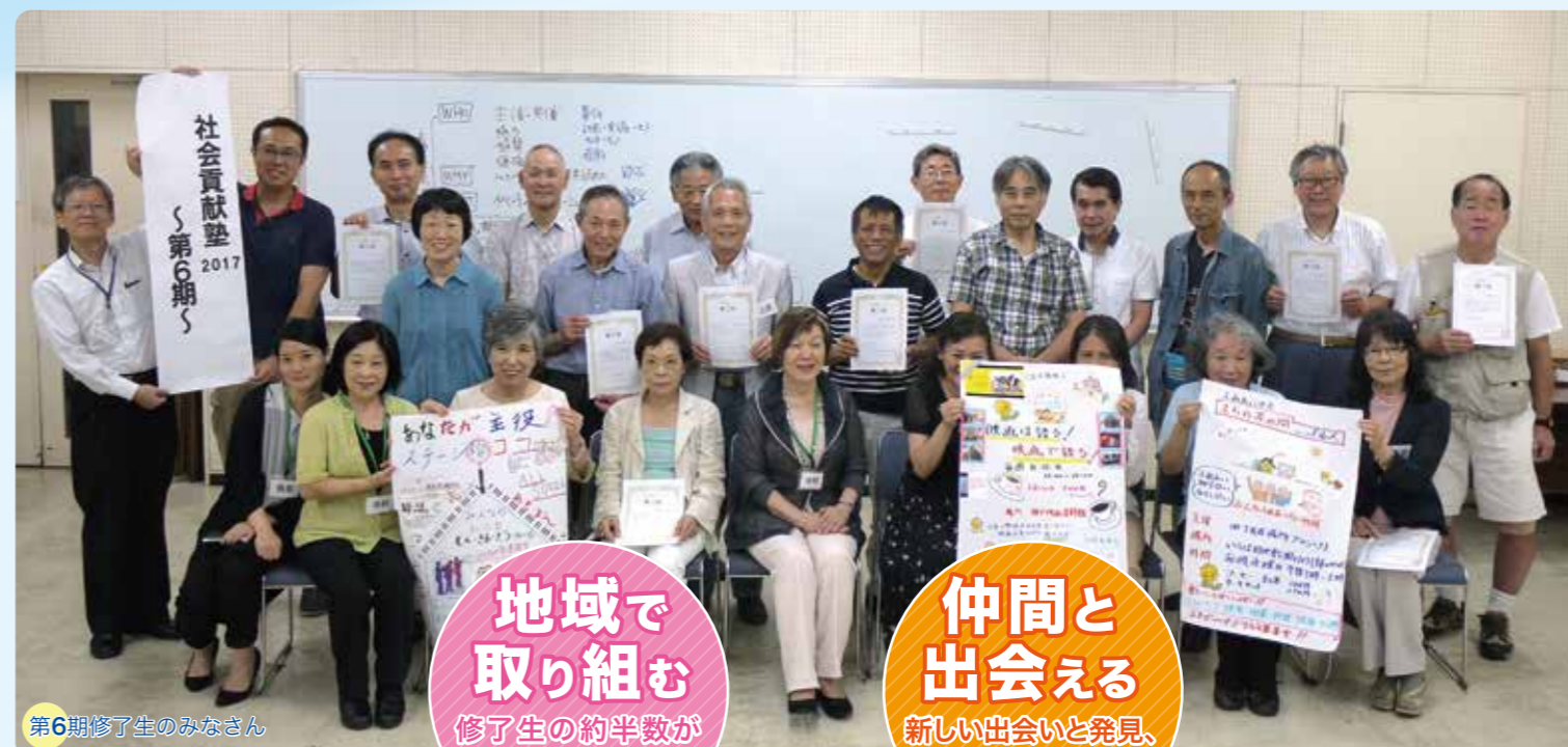
第6期修了生のみなさん

「社会貢献塾」は 座学と実習を通じて社会にどのような課題があるのか社会貢献活動にどのように参加していけばいいのかを総括的に学んでいただく連続講座です