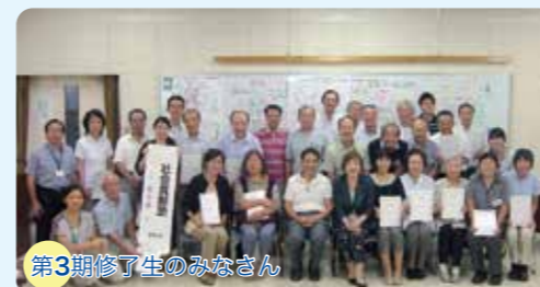
第3期修了生のみなさん