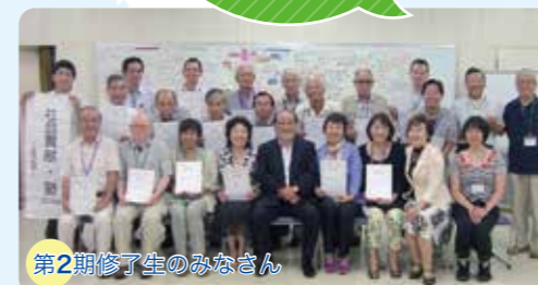
第2期修了生のみなさん