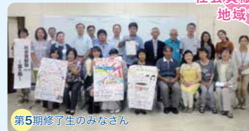
第5期修了生のみなさん

自らの経験やノウハウを活かして、人の役に立ちたい、何かをしたいと考えておられるみなさんのご参加をお待ちしています。