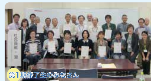
第1期修了生のみなさん