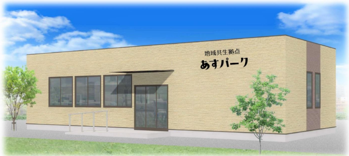
あすパーク外観イメージパース（プレハブ平屋建て約70㎡）

大震災から25年を機に、現在の少子高齢化の地域社会において、誰もがいつまでもいきいきと暮らせるよう居場所と役割を創り出す神戸発の先駆的モデルを目指します。