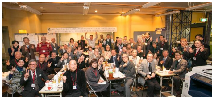
2015年新春のつどいの様子

認定 NPO 法人コミュニティ・サポートセンター神戸 (CS 神戸) 〒658-0052 神戸市東灘区住吉東町 5-2-2 ビュータワー住吉館 104 TEL 078-841-0310 FAX 078-841-0312 MAIL office@cskobe.com (担当:長井・飛田)