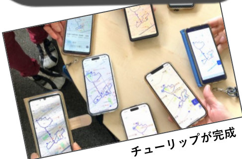
チューリップが完成

また、GPSアートを描きながら、 道や公園の不具合を見つけたら写真で記録！ 神戸市のLINE通報を活用して、 まちをもっと快適にしていきたいと思います。