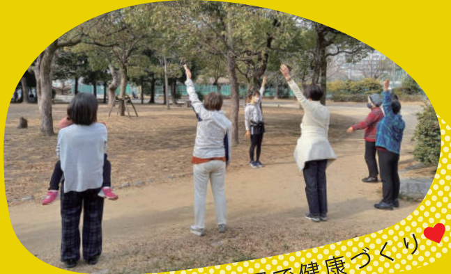
身近な公園で健康づくり