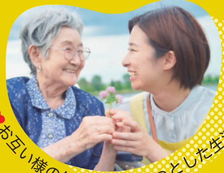
お互い様の気持ちでちょっとした生活支援