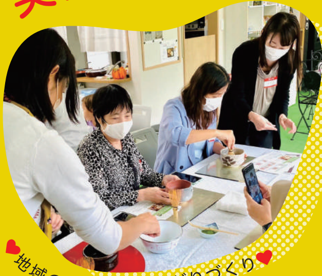
地域の居場所であつなかりづくり