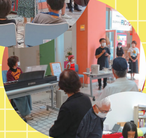
コミュニティスペース「RICのわ」