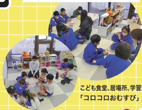
子ども食堂、居場所、学習支援「ココロおむすび」