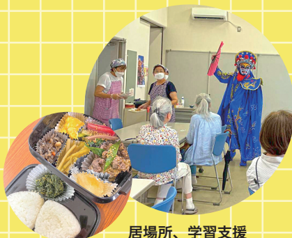
居場所、学習支援「つぼみ」