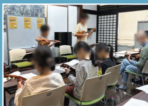
子どもたちが先生となり 学び場を創出