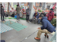
ゼミ(活動トライアル)