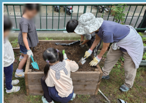
野菜づくりを通じた 防災(防災)活動