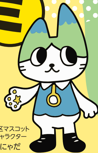
灘区マスコット キャラクター にやだ