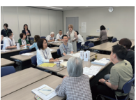
ゼミ(ワークショップ)