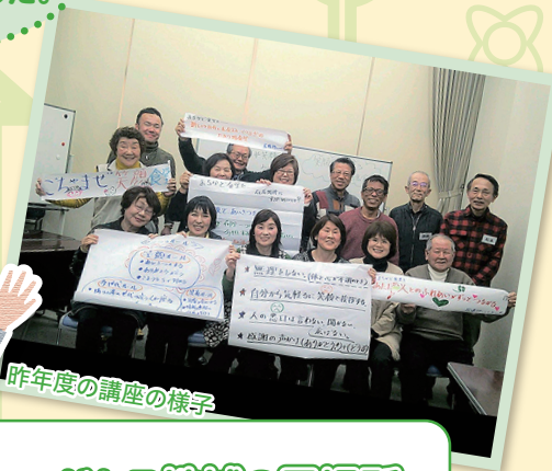
昨年度の講座の様子