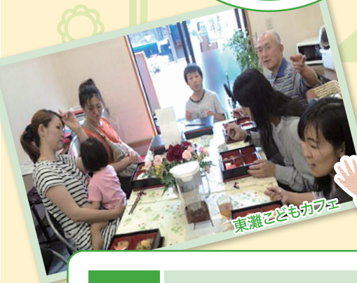
東灘子どもカフェ