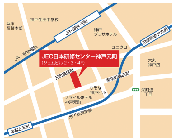
JR・阪神「元町駅」から徒歩3分 神戸市営地下鉄「県庁前駅」・阪急電鉄「三宮駅」から徒歩8分