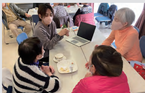
ICT 推進協議会 × 一般社団法人つばみ 「AI 交流プログラム」