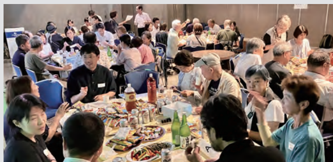
企業 × 居場所 「ごちゃまぜかふえ トワイライト交流会」