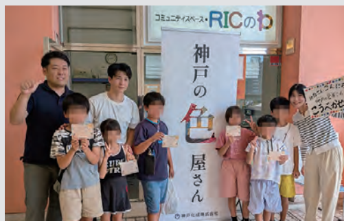
神戸化成(株) × RIC のわ 「天然色素実験」

※Peatix でのお支払いにご協力ください。会場参加の方は当日現金支払いも可です。